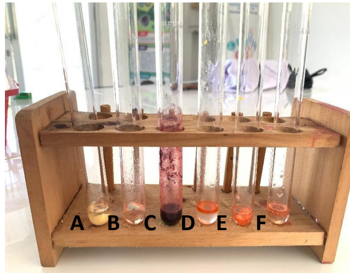
Gambar 1. Hasil pengamatan dengan menggunakan reagent pork

Hasil pengujian kandungan babi pada produk pangan yang ada di Kabupaten Sambas menggunakan reagent pork yang terdapat pada salah satu produk positif mengandung babi. Pada produk seperti kue selai, kue srikaya, pengembang kerupuk, marsmellow , kuas balas one, TBM, sosis bakar dan mi tiauw ditandai dengan tanda negatif menunjukkan bahwa produk tersebut tidak mengandung babi ( Gambar 1 & Gambar 2 ). Pada pengujian menggunakan reagent pork dapat mudah mengetahui kandungan babi pada suatu produk.