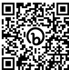
Gambar 3. Link kegiatan berupa QR code

Peserta diberikan beberapa pertanyaan berkaitan dengan biodata personal, komoditas kelapa sawit dan teknologinya serta produk yang dihasilkannya. Jawaban peserta dapat menggambarkan seberapa besar tingkat pengetahuannya terhadap teknologi pengolahan kelapa sawit. Pertanyaan dikemas dalam google form yang sangat mudah di akses dan paperless .