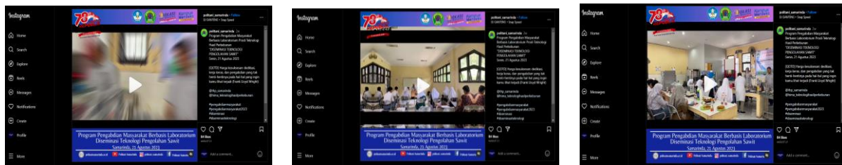
Gambar 5. Kegiatan dipublikasikan pada media sosial instagram @politani_samarinda

“Minyak CPO tidak dapat dibuat menjadi biofuel” sebanyak 50 % responden menjawab benar dan sebanyak 50 % responden menjawab salah.