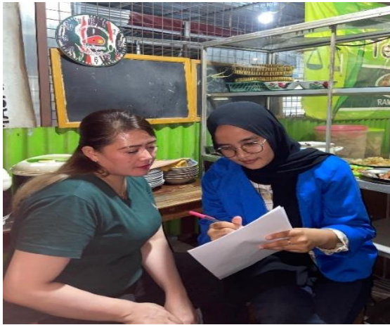
Gambar 4. Dokumentasi bersama pemilik Angkringan Tepi Barat

Pelaksanaan pengabdian masyarakat ini dilakukan secara bertahap, yaitu tahap survei tempat, tahap penyampaian materi, tahap pelatihan dan pendampingan dalam penyusunan laporan keuangan sederhana, dan yang terakhir adalah tahap evaluasi terhadap laporan keuangan sederhana yang telah dibuat oleh pelaku usaha. Tujuan pelatihan dan pendampingan penyusunan laporan keuangan sederhana adalah untuk meningkatkan pengetahuan dan keterampilan yang diperlukan para pelaku usaha dalam menyusun laporan keuangan sederhana. Tujuan lain dari kegiatan ini adalah meningkatkan kesadaran pelaku usaha akan pentingnya memiliki laporan keuangan yang sederhana namun akurat. Pelatihan dan pendampingan ini diharapkan akan membantu para pelaku usaha dalam mengelola keuangan dengan lebih baik dan membuat keputusan berdasarkan data dalam laporan keuangan usahanya.