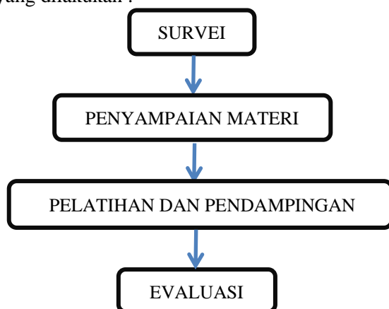
Gambar 3. Tahapan Pelaksanaan

Pendampingan dan pelatihan dilakukan dengan memberikan edukasi dan penyadaran akan pentingnya pelaporan keuangan bagi UMKM, serta pelatihan penyusunan laporan keuangan sederhana secara langsung kepada dua pelaku UMKM di Kota Yogyakarta. Berikut tahapan dan metode pelaksanaan kegiatan pengabdian masyarakat yang dilakukan :