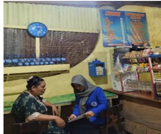
Gambar 5. Dokumentasi bersama dengan pemilik Warung Barokah

Berdasarkan hasil wawancara yang sudah dilakukan dengan para pelaku usaha, mereka tidak pernah melakukan pembukuan laporan keuangan. Hal ini terjadi karena kurangnya pemahaman dan informasi tentang penyusunan laporan keuangan, sehingga tidak dapat diketahui jumlah pengeluaran dan pendapatan setiap harinya, yang menyebabkan uang usaha dan uang pribadi tercampur. Akibatnya, laporan keuangan yang tidak jelas dapat menghambat perkembangan bisnis. Oleh karena itu, perlu dilakukannya pelatihan dan pendampingan dalam menyusun laporan keuangan sederhana untuk menghitung laba atau rugi bulanan.