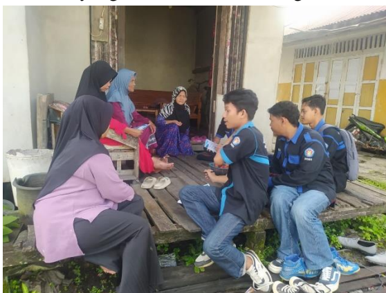
Gambar 1. Sosialisasi door to door

Kegiatan sosialisasi ini menitikberatkan pada pendekatan komunikasi dan pemberian brosur kepada masyarakat di Desa Jirak, penyuluhan ini menyampaikan informasi mengenai bahaya mengonsumsi ikan karena berdasarkan informasi yang kami dapat masyarakat di Desa Jirak masih mengonsumsi ikan-ikan yang telah tercemar di Sungai tersebut