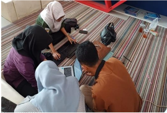
Gambar 3. Finalisasi proposal PKM sebelum submit ke sistem simbolmawa