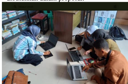
Gambar 2. Penyusunan Proposal PKM Bersama Dosen Pendamping

Pada tahap ini mahasiswa akan didampingi oleh dosen dalam melakukan searching dan pengunduhan file-file artikel yang relevan dengan skim PKM yang diusulkan oleh TIM PKM. Selain itu dalam tahap ini juga akan memberikan gambaran tentang ide-ide yang akan mahasiswa jadikan sebagai ide PKM yang diusulkan. Ide-ide yang unik akan dikemas dalam judul yang menarik. Selanjutnya setelah ide dan judul disetujui oleh dosen maka mahasiswa melakukan pendampingan dengan dosen untuk menyusun proposal mulai pendahuluan sampai dengan rencana kegiatan serta lampiran-lampiran yang dibutuhkan dalam proposal.