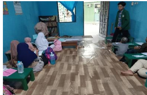
Gambar 4. Pendampingan Saat Permainan

Ketiga, setelah santri sudah merasa mengetahui jawaban tersebut, maka para santri mencari jawabannya dengan mencari di potongan kertas yang sudah disediakan sebelumnya. Kemudian, setelah mendapatkan nama surah dan ayatnya maka para santri akan menempelkan di kertas HVS yang kosong sesuai dengan urutan pertanyaan yang diberikan oleh peneliti tadi. Keempat, peneliti akan memberikan pertanyaan lagi dengan potongan surah yang berbeda-beda.