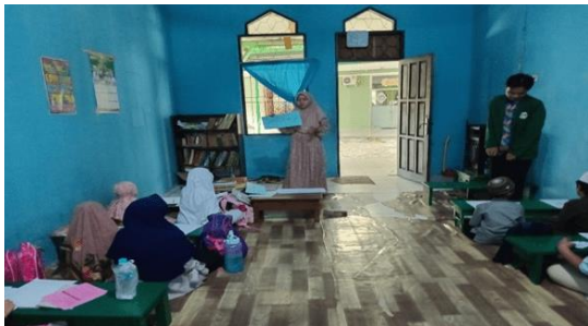
Gambar 3. Penjelasan Permainan Media Kartu

Kemudian kertas HVS yang kosong dan juga potongan kertas yang berisikan nama surah dan juga ayat ini akan dibagikan kepada para santri sambil memberitahukan mengenai kertas yang telah diberikan tersebut. Para santri akan mendapatkan masing-masing kertas tersebut.