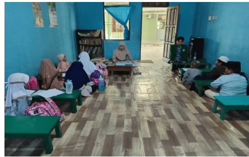
Gambar 1. Pembukaan Dengan Membaca Doa Bersama

Media kartu yang dimanfaatkan dan digunakan dalam proses pembelajaran sebagai alat pendukung saat pelaksanaan menghafal al-Qur'an pada murid. Media ini menjadi salah satu yang dapat dimanfaatkan ialah permainan kartu (Halim et al., 2021). Cara yang dilakukan bisa dengan salah satunya oleh seorang guru atau ustadz dan ustadzah agar hafalan yang sudah dihafalkan tetap ingat dengan apa yang disetorkan, maka peneliti menggunakan media kartu dalam hafalan surag-surah pendek dengan cara bermain game. Peneliti menyiapkan 3 lembar kertas yaitu Pertama, berisikan beberapa kertas yang berisikan potongan surah-surah pendek. Kedua, potongan kertas kecil yang berisikan nama surah beserta ayat. Berikut adalah hasil dokumentasi di TK/TPA Aqidah Palangka Raya.