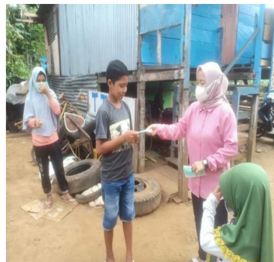
Gambar 3. Kegiatan Pembagian Masker

Gambar 2 di atas adalah kegiatan praktik mencuci tangan dengan benar menggunakan handsanitizer . Jadi anak-anak diberikan pemahaman bahwa menjaga kebersihan tangan di masa pandemik Covid-19 sangat penting dikarenakan, tangan dapat menjadi tempat penularan virus ini.