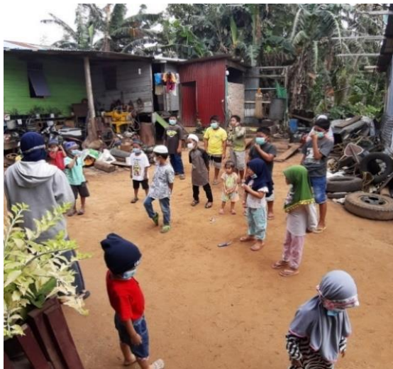
Gambar 1. Sosialisasi Kepada Anak-Anak di Pesisir Pantai Binaloka

Kegiatan kedua adalah kegiatan simulasi mencuci tangan yang benar menggunakan sabun serta handsanitizer . Selain itu ada juga kegiatan senam untuk mengenalkan kepada anak-anak bahwa olahraga itu penting serta dapat dilakukan disekitar rumah dengan gerakan-gerakan sederhana. Kegiatan mendapat respon yang sangat baik dari anak-anak atau peserta kegiatan, mereka sangat antusias mendengarkan dan mengikuti semua materi serta praktik langsung.