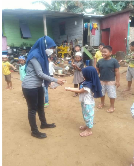
Gambar 2. Cuci tangan dengan benar menggunakan handsanitizer

Sosialisasi yang dilakukan dapat dilihat pada Gambar 1 di atas. Tim pengabdian bergantian memberikan materi dan praktik langsung tentang protokol kesehatan. Secara lisan pada Gambar 1, tujuannya adalah memberikan pemahaman kepada anak-anak bagaimana cara menerapkan protokol kesehatan dengan baik dan benar sehingga dapat memutus rantai penyebaran Covid-19.