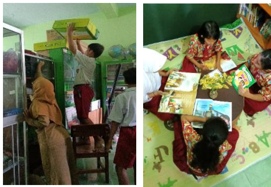
Gambar 2 Kegiatan administrasi dan membaca di perpustakaan

Kegiatan hari berikutnya, siswa diminta praktik meminjam dan mengaplikasikan administrasi sesuai arahan. Siswa diberikan jadwal untuk mengunjungi perpustakaan dan membuat jurnal membaca setelah membaca. Siswa diberikan kesempatan untuk membaca 10-15 menit setiap hari di perpustakaan. Kegiatan lain berupa pendampingan membaca bagi siswa yang mengalami kendala di ruang perpustakaan. Siswa yang belum mampu membaca diberikan tambahan jam pelajaran membaca. Pelaksanaan membaca dilakukan di perpustakaan agar tidak mengganggu teman lainnya. Pendampingan membaca dilakukan setiap hari selama 15 menit setelah kegiatan apel pagi.