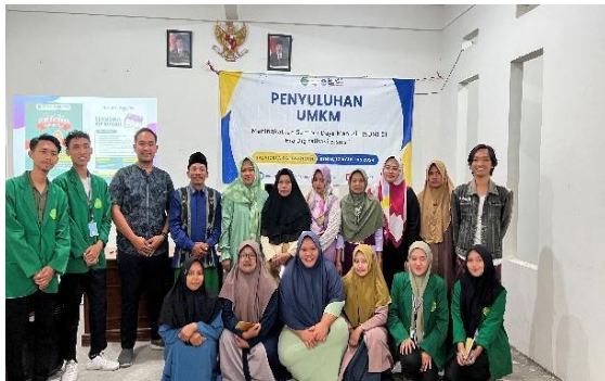
Gambar 3. Foto bersama perwakilan peserta dan Perangkat Desa

internasional, sehingga memperkuat identitas dan daya saing desa.