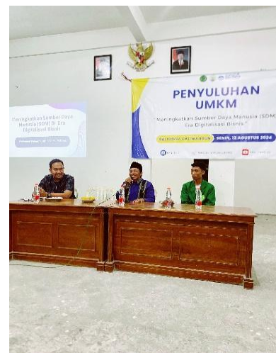
Gambar 2. Sambutan Kepala Desa Daliwangun sekaligus membuka acara

Bagi produsen, metode ini dianggap sangat menguntungkan karena dapat memangkas berbagai biaya tambahan. Tidak adanya kebutuhan untuk mengeluarkan biaya kemasan, pelabelan, maupun promosi iklan, memungkinkan produsen untuk fokus pada efisiensi produksi dan menjaga kualitas barang. Di sisi lain, penjual eceran mendapatkan fleksibilitas untuk membangun merek mereka sendiri dengan produk yang telah tersedia, sehingga kedua belah pihak dapat saling diuntungkan.