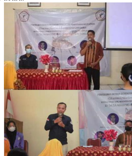
Gambar 2. Sambutan Kepala Desa Mayang dan Ketua Pengabdian Masyarakat

Memasuki kegiatan inti pengabdian diawali dengan sambutan dari masing-masing pihak yaitu Kepala Desa Mayang, Ketua Kader PKK, dan Ketua Pelaksana Pengabdian. Untuk mengukur pengetahuan awal masyarakat atau peserta mengenai penyakit demam berdarah maka dilakukan pre-test. Dengan hasil rata-rata nilai pengetahuan awal sebesar 83. Nilai tersebut tergolong baik untuk kategori pengetahuan awal dan akan dibandingkan terhadap nilai post-test yang dilakukan pada akhir acara.