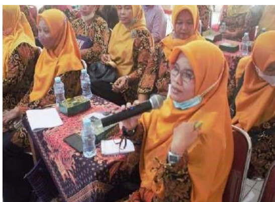
Gambar 5. Pertanyaan dari Peserta

target keberhasilan dari pertanyaan, yang muncul minimal 5 pertanyaan. Berikut 7 bentuk pertanyaan yang disampaikan oleh peserta; (1) Paraffin wax dapat dibeli dimana dan harga 1 kg paraffin wax ini berapa? (2) Kira-kira 1 kg parafin itu bisa jadi berapa lilin? (3) Apakah lilin aromaterapi ini bisa digunakan untuk mengusir nyamuk? (4) Bagaimana penggunaan abate yang benar? (5) Pada saat apa nyamuk DBD biasanya muncul? Apakah pada pagi hari, siang hari, menjelang magrib, atau malam hari? (6) Apakah kulit lemon untuk lilin aroma terapi bisa diganti dengan kulit jeruk nipis? (7) Berapa perbandingan air dan abate saat akan digunakan? Apakah kalau menggunakan ember tidak perlu penggunaan abate?.