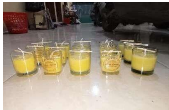
Gambar 4. Produk Lilin Aroma Terapi Penolak Nyamuk dari Kulit Lemon.

Jeruk lemon merupakan salah satu tanaman penghasil minyak atsiri yang sebagian besar mengandung terpen, siskuiterpen alifatik, turunan hidrokarbon teroksigenasi dan hidrokarbon aromatik. Kulit lemon terdiri dari dua lapisan yaitu lapisan luar dan lapisan dalam. Lapisan luar, mengandung minyak esensial yang terdiri dari citral (5%) dan limonen, serta \alpha -terpineol, geranil asetat dan linali. Lapisan dalam mengandung kumarin, glikosida, dan flavonoid. Kulit jeruk lemon berpotensi sebagai insektisida dengan kandungan aktif dari kulit jeruk lemon yaitu limonoid (Deo et al., 2022). Menurut Kia & Parisa (2014) kandungan kimia lain dari kulit lemon diantaranya yaitu geranil, asetat, nerol, linalil asetat, yang memiliki efek kesehatan antidepresan, antiseptik, antispasmodik, penambah gairah seksual, dan obat penenang ringan.