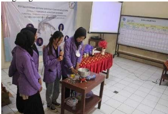
Gambar 3. Demonstrasi Pembuatan Produk Lilin Aroma Terapi Penolak Nyamuk dari Kulit Lemon

Setelah dua materi pengetahuan selesai disampaikan acara disambung dengan pembuatan produk aroma terapi berkhasiat penolak nyamuk dari kulit buah lemon. Sebelumnya disajikan singkat mengenai kandungan didalam kulit buah lemon dan cara memprosesnya. Pembuatan lilin berkhasiat aroma terapi penolak nyamuk dilakukan lewat demonstrasi secara langsung di depan responden dan kepada salah satu peserta diberi kesempatan untuk mencobanya secara langsung.