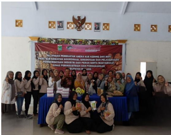
Gambar 2. Dokumentasi Pelatihan Pembuatan Aneka Kue dan Roti

Selain itu, Kecamatan Turen (27–28 Mei 2025), menjadi lokasi pelatihan aneka olahan kedelai, sementara Desa Tumpuk Renteng, Kecamatan Turen (9–10 Juli 2025), mengadakan pelatihan aneka olahan ikan lele. Kedua pelatihan ini juga menghadirkan P4S Intan dari Kecamatan Pagelaran sebagai narasumber.