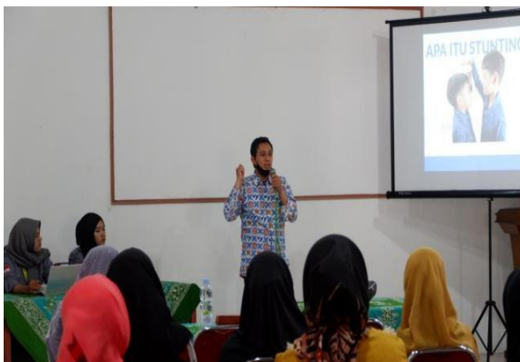
Gambar 1. Pemaparan Pencegahan Stunting Kemudian dilanjutkan Kembali pengisian post-test untuk mengukur pengetahuan pada ibu hamil dan remaja putri di Desa Bakalan.

Materi yang diberikan mencakup penjelasan mengenai definisi stunting, faktor penyebab, dampak jangka panjang, strategi pencegahan, serta pentingnya konsumsi tablet tambah darah. Untuk membantu peserta memahami materi dengan lebih baik, digunakan berbagai media visual seperti presentasi Power Point, video edukatif, dan ilustrasi interaktif yang menarik.