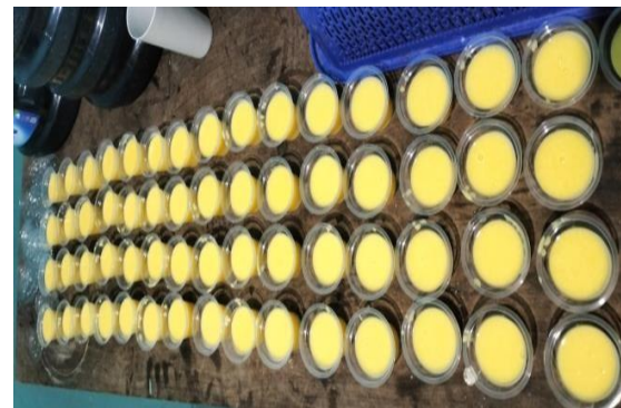
Gambar 2. PMT Pudding Jagung

Setelah sesi diskusi, peserta kembali mengisi kuesioner post-test untuk mengukur peningkatan pemahaman mereka setelah menerima edukasi.