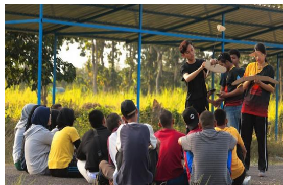
Gambar 2. Pengenalan Teknis Aeromodelling

FASI berperan sebagai lembaga resmi penyelenggara aeromodelling di Indonesia. Organisasi ini membawahi seluruh kejuaraan aeromodelling nasional dan mengeluarkan sertifikasi rekor pada tingkat nasional. Keanggotaannya terbuka bagi siapa saja yang berminat dengan penerbangan model, dan sebagai badan nirlaba yang mandiri Pordirga Aeromodelling berfokus memajukan cabang kegiatan ini baik sebagai olahraga maupun sarana rekreasi. Sesuai struktur organisasinya, Pordirga Aeromodelling mengatur seluruh klub aeromodelling di tanah air, termasuk standar pelaksanaan pertandingan, aspek keselamatan dan asuransi, serta penyediaan lapangan terbang model. Sebagai satu dari tujuh cabang olahraga dirgantara di bawah Pengurus Besar Federasi Aero Sport Indonesia (PB FASI), Pordirga Aeromodelling juga terafiliasi dengan Federation Aeronautique Internationale (FAI) , badan dunia yang mengawasi olahraga dirgantara. Hanya Pordirga Aeromodelling PB FASI yang berwenang mengutus wakil Indonesia dalam ajang aeromodelling internasional dan bertindak sebagai perwakilan resmi PB FASI dalam urusan aeromodelling di dalam dan luar negeri (FASI, 2006).