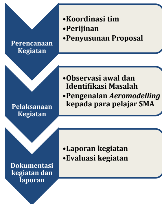
Gambar 3. Tahapan Kegiatan Pengabdian Masyarakat

Materi yang disampaikan dalam pengenalan Aeromodelling ini meliputi, prinsip kerja pesawat terbang, gaya angkat pada sayap pesawat, sikap pesawat, sistem penggerak dan kendali pesawat, transmitter dan receiver pada pesawat Remote Control (RC) , titik berat pesawat atau centre of gravity (CG) , electronic speed controller (ESC) dan Servo .