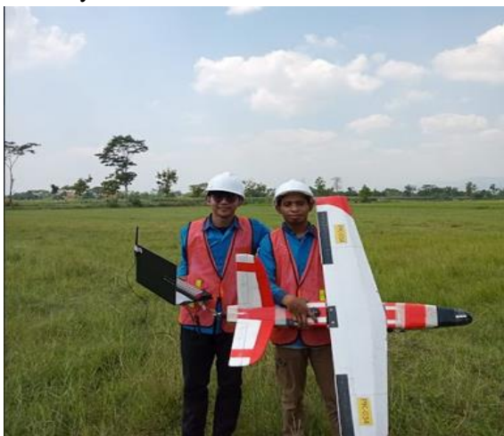
Gambar 1. Kegiatan Aeromodelling Kategori RC Plane

Peminat ilmu pengetahuan dan teknologi baik perorangan ataupun yang tergabung dalam organisasi sosial kemasyarakatan biasanya menggemari kegiatan ini, mereka menggunakannya untuk menyebarluaskan minat kedirgantaraan di bidang aeromodelling . Namun begitu, tidak semua daerah/wilayah memiliki organisasi/komunitas aeromodelling , hal tersebut menunjukkan minatnya masih sangat sedikit. Adanya pandangan terkait faktor biaya yang dianggap mahal menjadi salah satu hal mendasar kurangnya minat untuk mendalami olahraga tersebut. Karenanya program pengabdian ini dilaksanakan dengan harapan dapat menjadi salah satu media memperkenalkan olahraga aeromodelling sehingga kelak dapat menjadi hobi maupun sebagai sarana menjalin hubungan sosial bermasyarakat.