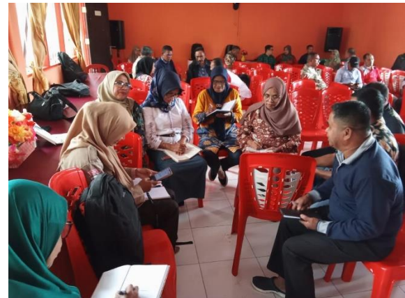
Gambar 2. Proses Diskusi