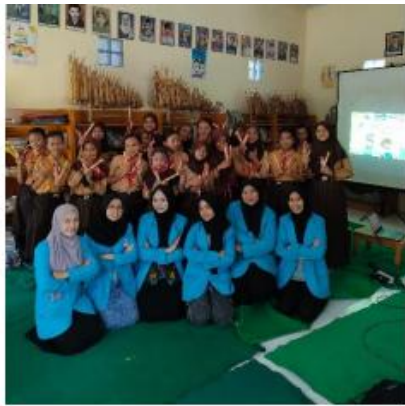
Gambar 4. Siswa putri dan mahasiswi pendamping serta pendidik.