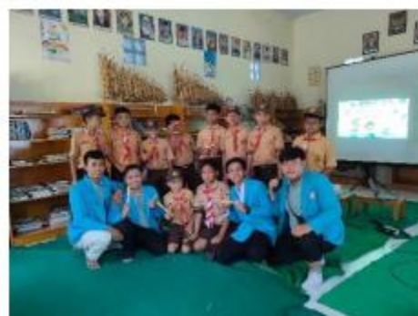
Gambar 3. Siswa putra dan mahasiswa pendamping.

Maka dari hasil yang didapat selama proses pengabdian masyarakat berupa kegiatan belajar kelompok untuk memotivasi belajar dan prestasi siswa sangat baik untuk diterapkan selama kegiatan belajar mengajar. Belajar kelompok atau Kerja sama dalam belajar memiliki peran penting dalam menciptakan lingkungan pembelajaran yang memuaskan dan menyegarkan bagi siswa sekolah dasar untuk berkembang menjadi warga yang sadar dan berdaya (Aldred & Fox 2019; Apriliani et al. 2024; Eybers et al. 2024).