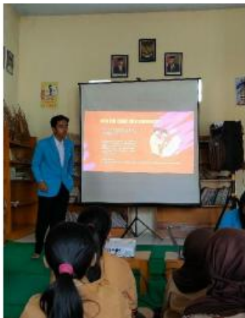
Gambar 5. Kegiatan belajar mengajar.