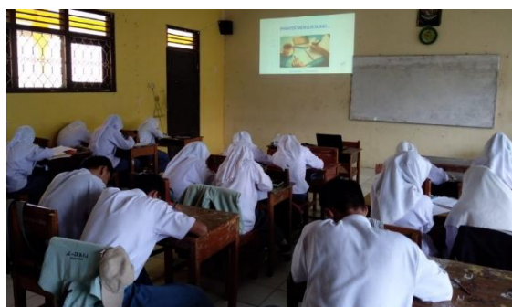
Gambar 1. Pelatihan siswa menulis surat lamaran kerja

Edukasi dan pelatihan dilaksanakan secara klasikal di dalam kelas dan praktik langsung mengerjakan psikotes dan membuat surat lamaran kerja. Selain itu dengan menggunakan metode ceramah visual dengan memberikan informasi mengenai proses interview yang dilakukan oleh beberapa organisasi saat proses rekrutmen secara umum. Pada gambar 2 menunjukkan bahwa siswa sedang melaksanakan pelatihan membuat surat lamaran kerja sesuai dengan struktur dan tata bahasa yang sesuai dengan standar perkembangan era saat ini. Hal tersebut sesuai dengan proses perkembangan belajar bahwa individu harus mampu menyesuaikan dengan pendidikan modern saat ini (Magpiroh & Mudzafar, 2023). Peningkatan sumber daya manusia menjadi mutlak karena tuntutan perkembangan zaman semakin meningkat.