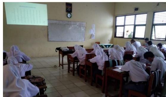
Gambar 2. Pelatihan psikotes bagi siswa menggunakan instrumen psikologi

etika yang berlaku tujuannya agar sejalan dengan pengetahuan belajar yang telah diterima serta meningkatkan pemahaman soft skill yang telah diterima selama di sekolah (Agrestian & Munadi, 2025; Magpiroh & Mudzafar, 2023). Pentingnya mengelola keterampilan belajar pada saat ini menjadi kebutuhan dan tuntutan dasar bagi setiap individu sesuai hasil penelitian dari yang sudah dilakukan sebelumnya terutama di era revolusi industri 4.0 (Mardhiyah et al., 2021).