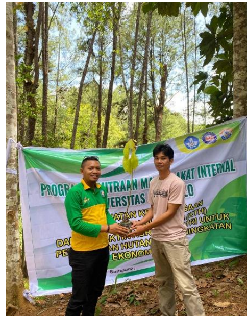
Gambar 3. Penyerahan bibit secara simbolis

Berdasarkan diskusi tersebut, berbagai rencana tindak lanjut diusulkan untuk mengembangkan usaha produktif dengan melibatkan tim dosen kehutanan berpengalaman yang berada di bidangnya. Mengacu pada beberapa penelitian, peningkatan kapasitas perlu dilakukan secara serentak dan berkesinambungan untuk mendukung kemandirian kelompok dalam kegiatan (Wulandari & Christine, 2022). Dalam kegiatan ini juga dilakukan penyerahan sejumlah bibit tanaman kehutanan dan MPTs kepada kelompok tani (Gambar 3).