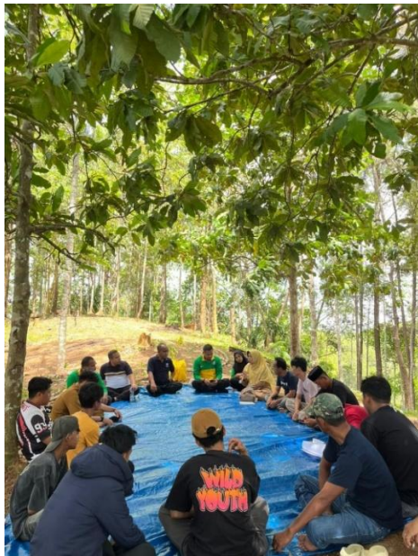
Gambar 2. Pemaparan materi dari narasumber

Kegiatan yang berlangsung selama 4 jam ini memberikan kesempatan kepada peserta untuk terlibat dalam diskusi melalui sesi tanya jawab. Antusiasme peserta ditunjukkan melalui beberapa pertanyaan yang ditujukan kepada para pembicara. Selain menjawab pertanyaan, peserta juga berbagi pengalaman dan pengetahuan, serta isu-isu praktis yang dihadapi dalam pengelolaan hutan. Kegiatan ini memberikan banyak manfaat kepada peserta, termasuk memahami potensi sumber daya dan bagaimana mengelolanya untuk memberikan manfaat ekologis dan ekonomi yang berkelanjutan.