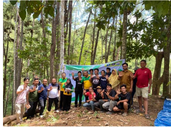
Gambar 4. Kegiatan Pengabdian pada kelompok tani Harapan Rakyat

Secara keseluruhan, kegiatan edukasi kelembagaan ini memberikan kontribusi awal dalam memperkuat kapasitas Kelompok Tani Hutan Harapan Rakyat sebagai pengelola izin HKm yang baru. Penguatan pengetahuan, kesadaran kelembagaan, dan munculnya rencana tindak lanjut menjadi fondasi penting bagi pengembangan kelompok di masa mendatang. Jika diikuti dengan pendampingan lanjutan dan integrasi dengan program-program teknis agroforestri, maka penguatan kelembagaan ini berpotensi mendorong tercapainya tujuan ganda perhutanan sosial, yaitu pelestarian hutan dan peningkatan kesejahteraan masyarakat sekitar hutan.