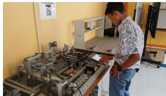
Gambar 4. Praktik Pengisian Botol Otomatis

Ketersediaan perangkat seperti PLC, HMI, sensor, aktuator, sistem conveyor, serta modul otomasi terintegrasi memungkinkan siswa memahami secara langsung cara kerja teknologi yang digunakan dilini produksi modern. Dengan fasilitas tersebut, siswa tidak hanya mempelajari konsep teori, tetapi juga memperoleh kompetensi operasional melalui praktik nyata, misalnya pada sistem otomasi pengisian botol minum secara otomatis seperti ditunjukkan pada Gambar 4. Melalui praktik tersebut, siswa belajar mengonfigurasi sensor level, memprogram urutan kerja pada PLC, melakukan sinkronisasi antara motor, valve, dan conveyor, serta menerapkan prosedur troubleshooting ketika terjadi gangguan. Pengalaman praktik yang komprehensif ini sangat penting untuk memastikan bahwa lulusan memiliki keterampilan teknis yang sesuai standar industri dan siap memasuki dunia kerja berbasis otomasi.