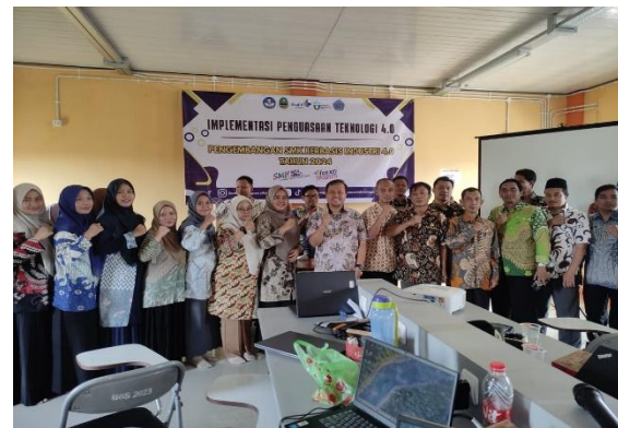
Gambar 2. Pelatihan Teknologi 4.0

pelatihan para guru ini dapat dilihat pada Gambar 2.