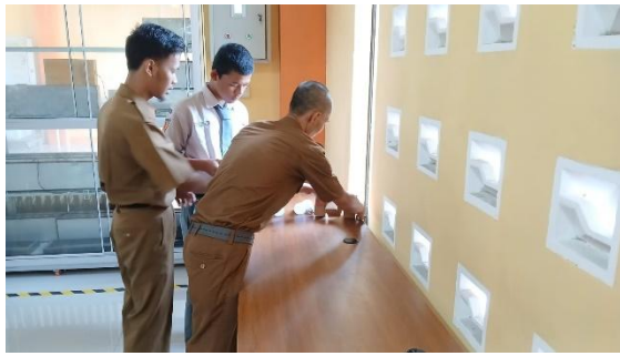
Gambar 3. Membuat laboratorium otomasi industri

Permasalahan keempat adalah keterbatasan kemitraan dengan industri. Lokasi sekolah yang strategis seharusnya dimanfaatkan untuk membangun kerja sama dengan perusahaan sekitar. Solusinya adalah memperkuat kemitraan melalui MoU yang mencakup magang siswa, pelatihan guru, kunjungan industri, dan guest lecture dari praktisi. Pembentukan Forum Link and Match SMK-Industri menjadi langkah penting untuk memastikan komunikasi rutin terkait perkembangan teknologi dan kebutuhan industri. Kegiatan kunjungan industri bagi guru dan siswa dijadwalkan minimal dua kali setahun untuk melihat penerapan otomasi secara langsung.