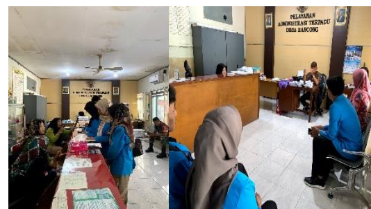
Gambar 2. Survey dan Wawancara

Pada tahap pertama kegiatan survey dan observasi dilakukan oleh dosen dan mahasiswa dengan langsung datang di lokasi desa. Wawancara juga langsung dilaksanakan kepada Kepala Desa dan Kepala Dusun. Berdasarkan survey, observasi dan wawancara didapatkan data bahwa desa belum memiliki website yang berbasis informasi potensi dusun, infografis dusun, UMKM serta info geospal desa. Hal ini memberikan dampak penyampaian informasi potensi desa yang kurang luas. Adapun proses survey, observasi dan wawancara dapat dilihat pada Gambar 2 berikut ini: