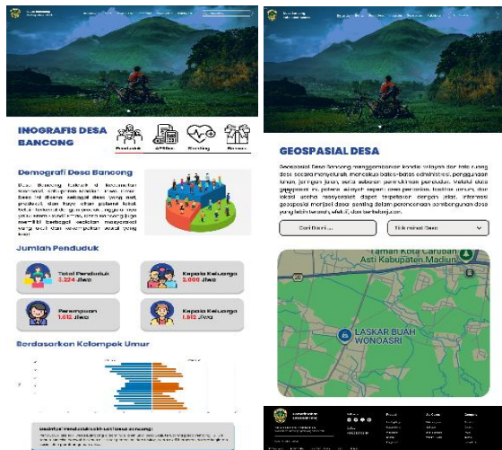
Gambar 4. Halaman Informasi Website Desa Bancong

Kepala dusun memiliki hak akses untuk mengelola website. Kepala dusun bisa memperbaharui informasi yang berkaitan dengan informasi dusunnya masing-masing. Masyarakat bisa mengakses informasi yang disajikan dihalaman website. Adapun contoh tampilan informasi pada halaman website dapat dilihat pada Gambar 4 dibawah ini