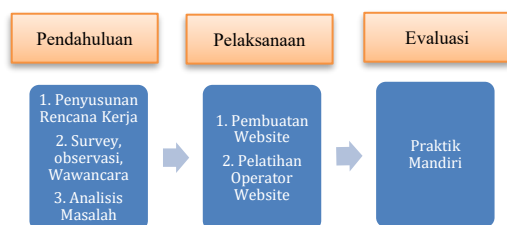
Gambar 1. Tahapan Kegiatan

Kegiatan pengabdian masyarakat ini dilaksanakan sebagai implementasi program kerja kebangsaan desa digital kreatif KKN Tematik Berdampak Universitas PGRI Madiun. Lokasi kegiatan ada di Desa Bancong Kecamatan Wonoasri Kabupaten Madiun. Pelaksanaan kegiatan dimulai dari tanggal 4 November 8 Desember 2025. Adapun tahapan kegiatan dapat di lihat pada gambar 1 dibawah ini: