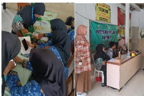
Gambar 5. Pelatihan dan Evaluasi Website

Pembuatan website selesai dilaksanakan maka tahap berikutnya adalah pelaksanaan pelatihan pengoperasian website kepada perangkat desa terdiri atas 3 kepala dusun dan 12 perwakilan warga dan pemuda desa. Kegiatan pelatihan dilaksanakan selama 2 hari, dimana hari pertama pelaksanaan pelatihan dan hari kedua pelaksanaan evaluasi. Metode kegiatan pelatihan adalah dengan praktik langsung dipandu oleh tim dosen dan mahasiswa. Peserta mengikuti penjelasan dan instruksi dari dosen berkaitan dengan fungsi dan cara pengoperasian setiap fitur, mahasiswa akan membantu proses praktik jika ada peserta yang kesulitan memahami instruksi. Adapun kegiatan pelatihan dan evaluasi website dapat dilihat pada Gambar 5 dibawah ini