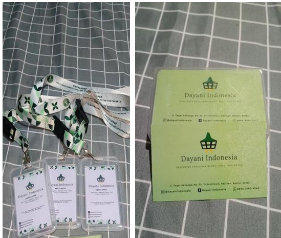
Gambar 5. Identitas Perusahaan