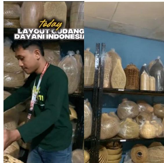
Gambar 6. Optimalisasi tata letak Gudang

Penataan ulang gudang dengan prinsip 5R (Ringkas, Rapi, Resik, Rawat, Rajin) dapat meningkatkan produktivitas UMKM dengan menciptakan efisiensi dan efektivitas kerja melalui pengaturan rak yang baik dan label penomoran yang jelas, sehingga mengurangi waktu pencarian barang (Pranata et al., 2024). Dengan demikian, gudang yang terorganisir tidak hanya memudahkan pegawai dalam menemukan barang, tetapi juga meningkatkan efisiensi kerja dan mendukung kelancaran produksi. Di UMKM Dayani Indonesia, sebanyak 50 unit kap lampu yang beragam telah diidentifikasi dan disusun ulang di rak baru menggunakan sistem penomoran dua digit (misalnya LM 01–LM 50). Penerapan prinsip 5R telah menjadikan layout gudang lebih rapi dan efisien, dengan pemanfaatan ruang yang optimal, sehingga mempermudah pencarian dan pengelolaan stok barang.