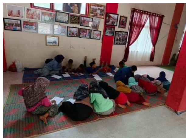
Gambar 1. Dokumentasi Pendampingan Kegiatan