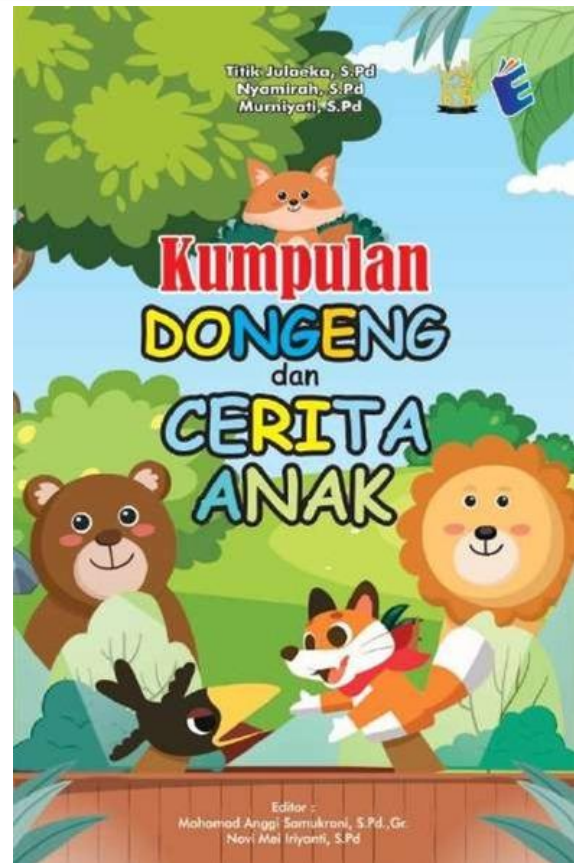
Gambar 5. Buku Cerita