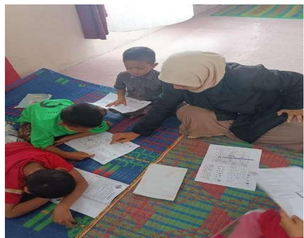
Gambar 2. Dokumentasi Pendampingan Kegiatan