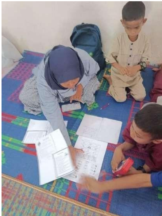
Gambar 3. Dokumentasi Pendampingan Kegiatan