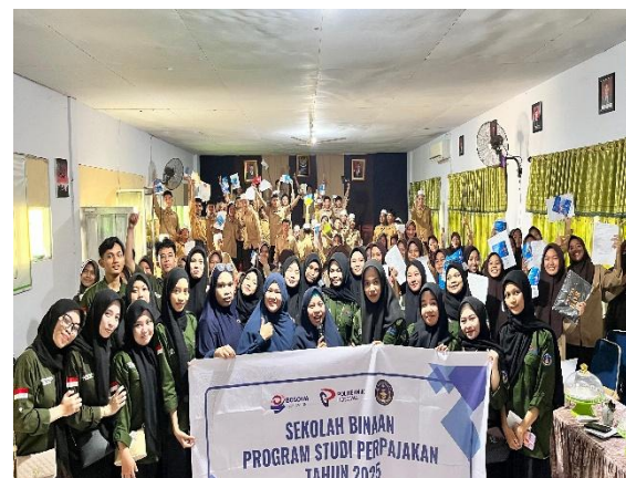
Gambar 4. Penutupan Acara Sosialisasi

Banyak masyarakat Indonesia belum memahami tujuan perpajakan, sehingga pembayaran pajak belum optimal. Banyak orang belum memahami pajak dan manfaatnya. Mereka tidak tahu apa yang diperoleh dari membayar pajak. Untuk