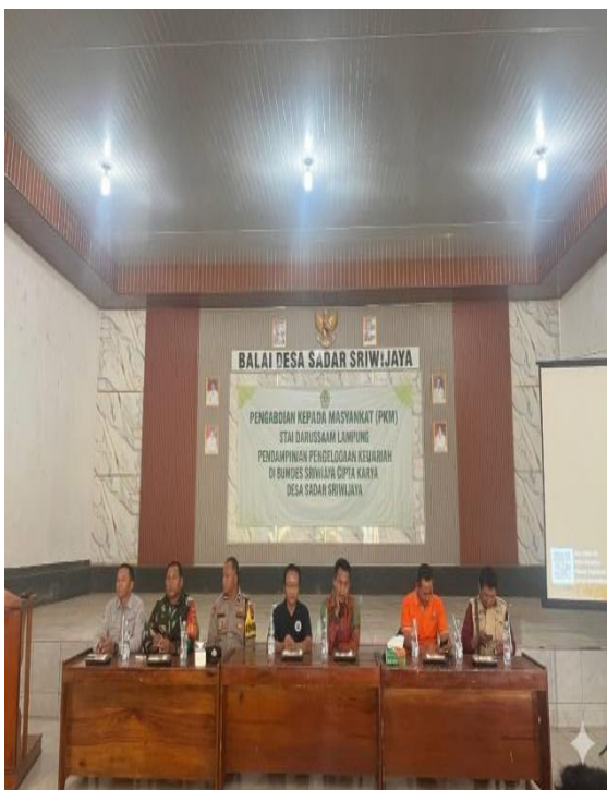
Gambar 3. Pendampingan Pelatihan Pengelolaan Keuangan.