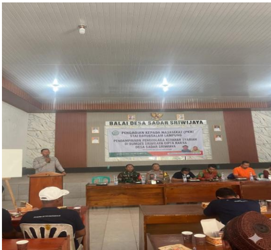
Gambar 2. Pelaksanaan Pelatihan Pengelolaan Keuangan

mengadakan sesi tanya jawab sebelum kegiatan berakhir. Dengan cara ini, peserta dalam latihan PKM ini dapat memperoleh manfaat dari apa yang telah kami sampaikan dan tawarkan.