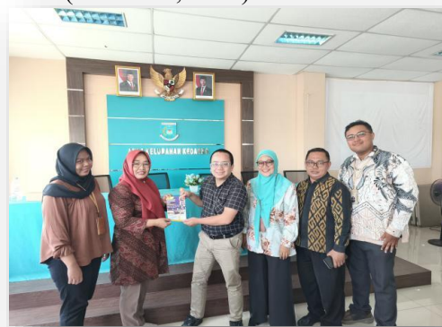
Gambar 2. Penyerahan Brosur UNPAM

Tahap observasi dilakukan untuk mengidentifikasi kebutuhan, permasalahan, dan karakteristik khalayak sasaran. Tim dosen pengabdian bersama perwakilan mitra melakukan diskusi awal dengan ibu-ibu kader PKK Kelurahan Kedaung. Fokus observasi meliputi tingkat pemahaman media digital, pola penggunaan media sosial, pengalaman menerima informasi negatif, serta tantangan komunikasi yang dihadapi dalam aktivitas organisasi dan kehidupan sehari-hari. Data yang diperoleh menjadi dasar dalam perancangan materi pelatihan yang kontekstual dan tepat sasaran (Nasrullah, 2020).