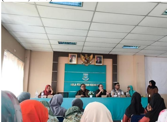
Gambar 3. Pelaksanaan Pelatihan dan Diskusi

Pelaksanaan pelatihan merupakan inti kegiatan PkM dan dilakukan melalui beberapa sesi interaktif. Kegiatan diawali dengan diskusi ringan mengenai pengalaman peserta dalam menggunakan media digital, termasuk paparan terhadap hoaks dan informasi negatif. Selanjutnya, peserta diajak untuk mengidentifikasi ciri-ciri hoaks, menganalisis pesan-pesan bermuatan provokatif, serta mendiskusikan praktik komunikasi digital yang etis di lingkungan keluarga dan komunitas. Metode partisipatif digunakan agar peserta aktif terlibat dalam proses pembelajaran, berbagi pengalaman, serta melakukan refleksi kritis terhadap praktik bermedia digital yang selama ini dilakukan. Setiap sesi dilengkapi dengan umpan balik langsung dari fasilitator guna memperkuat pemahaman peserta dan memberikan ruang perbaikan secara konstruktif (Ribble, 2015).