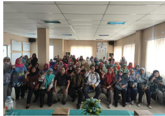
Gambar 4. Khalayak Sasaran, Kader PKK

Khalayak sasaran kegiatan PkM ini adalah ibu-ibu kader PKK Kelurahan Kedaung dengan jumlah peserta sebanyak 50 orang. Peserta dipilih berdasarkan keterlibatan aktif dalam kegiatan PKK dan peran strategis mereka sebagai penggerak sosial di tingkat keluarga dan komunitas.