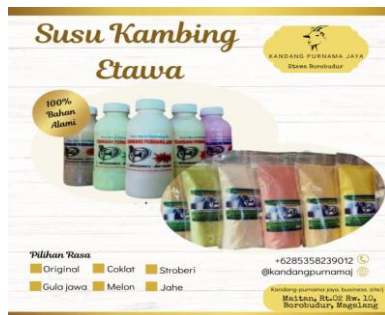
Gambar 6. Flyer versi 3