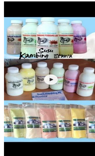
Gambar 10. Screenshot Video versi 2 Durasi 6 Detik