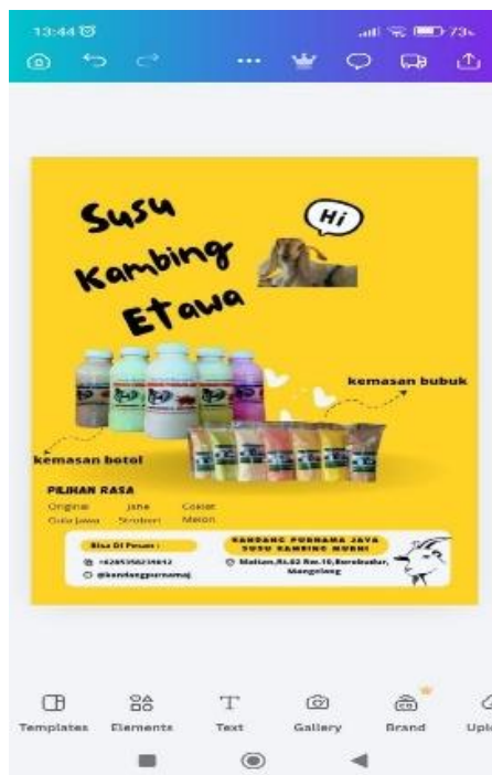
Gambar 2. Proses Pembuatan konten Flyer dengan Aplikasi Android Canva