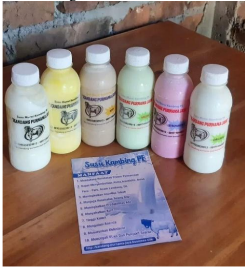
Gambar 1. Gambar Produk