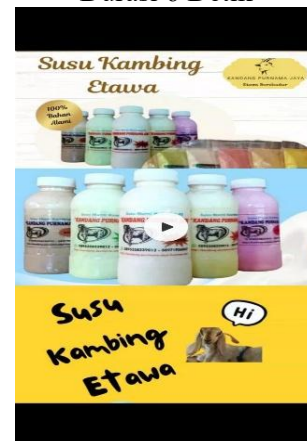
Gambar 11. Screenshot Video versi 2 Durasi 12 Detik