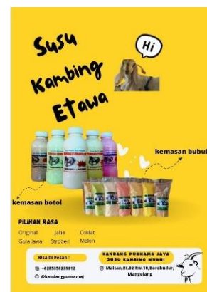
Gambar 4. Flyer versi 1