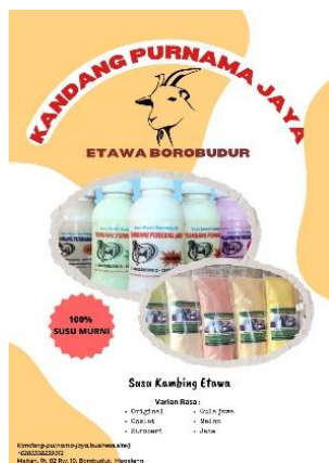
Gambar 8. Flyer versi 5

b. Konten promosi dalam bentuk video (gabungan foto dan musik) untuk dipublikasikan di reels Facebook, Instagram dan TikTok