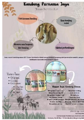
Gambar 5. Flyer versi 2