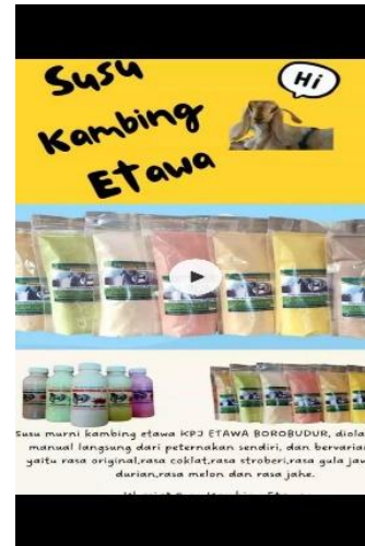
Gambar 9. Screenshot Video versi 1 Durasi 8 Detik

b. Konten promosi dalam bentuk video (gabungan foto dan musik) untuk dipublikasikan di reels Facebook, Instagram dan TikTok