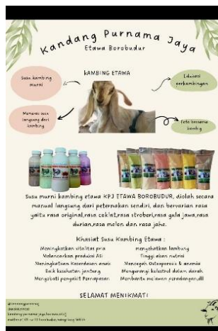
Gambar 7. Flyer versi 4